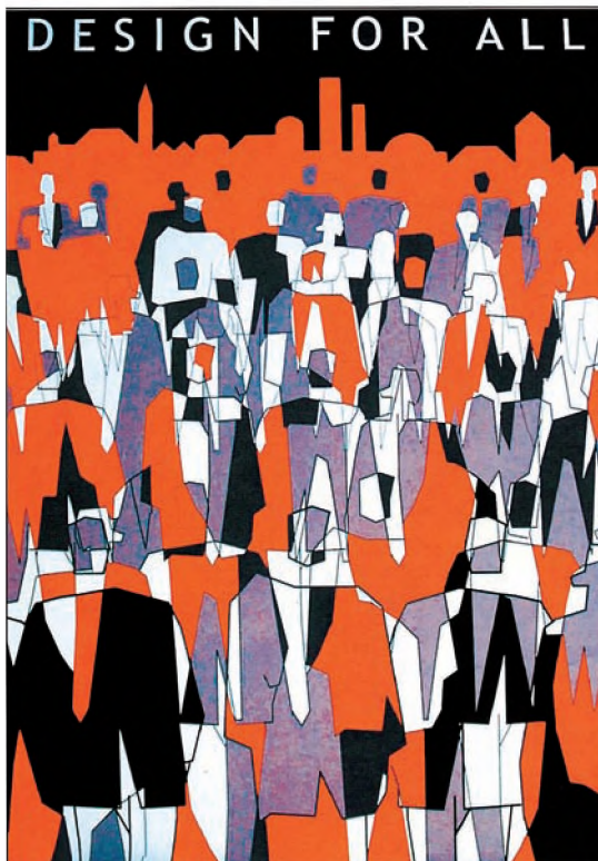
Desen: Marlena Happach

Düzenli yüzü şehirlerde düzenli ruhlu in-